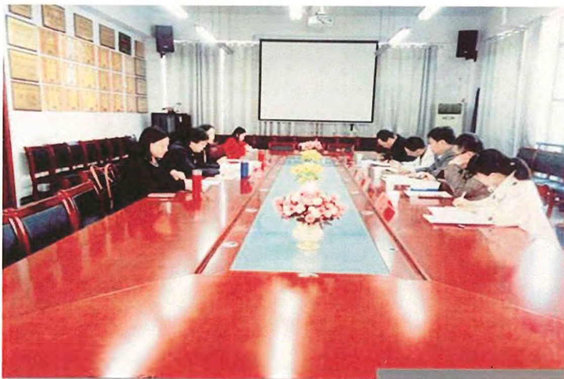
信阳师范学院考察团来我校交流 (2017. 11)