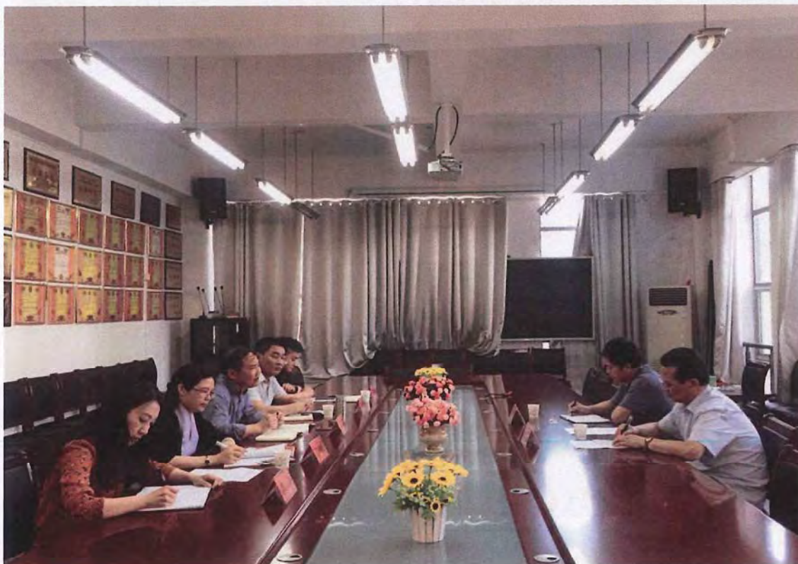
宝鸡职业技术学院凤翔师范分院考察团来我校交流（2017.05）