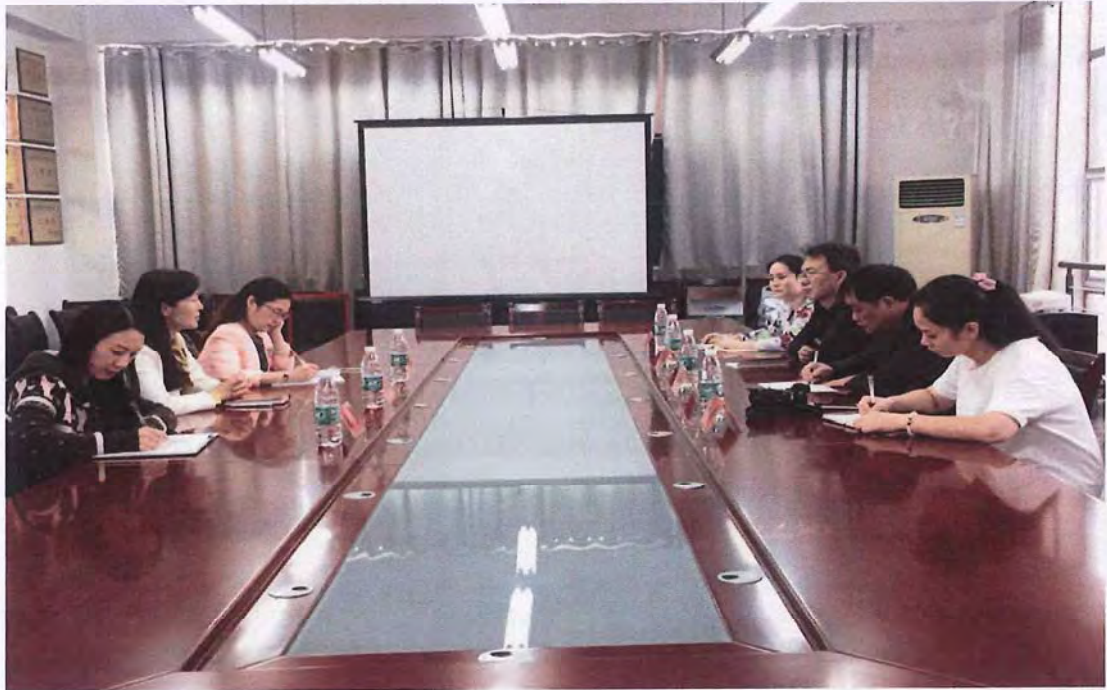
汉江师范学院考察团来我校交流（2016.10）