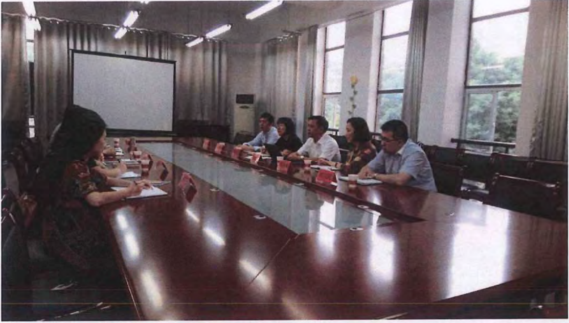
浙江师范大学教师教育学院代表团来我校考察交流（2015.06）