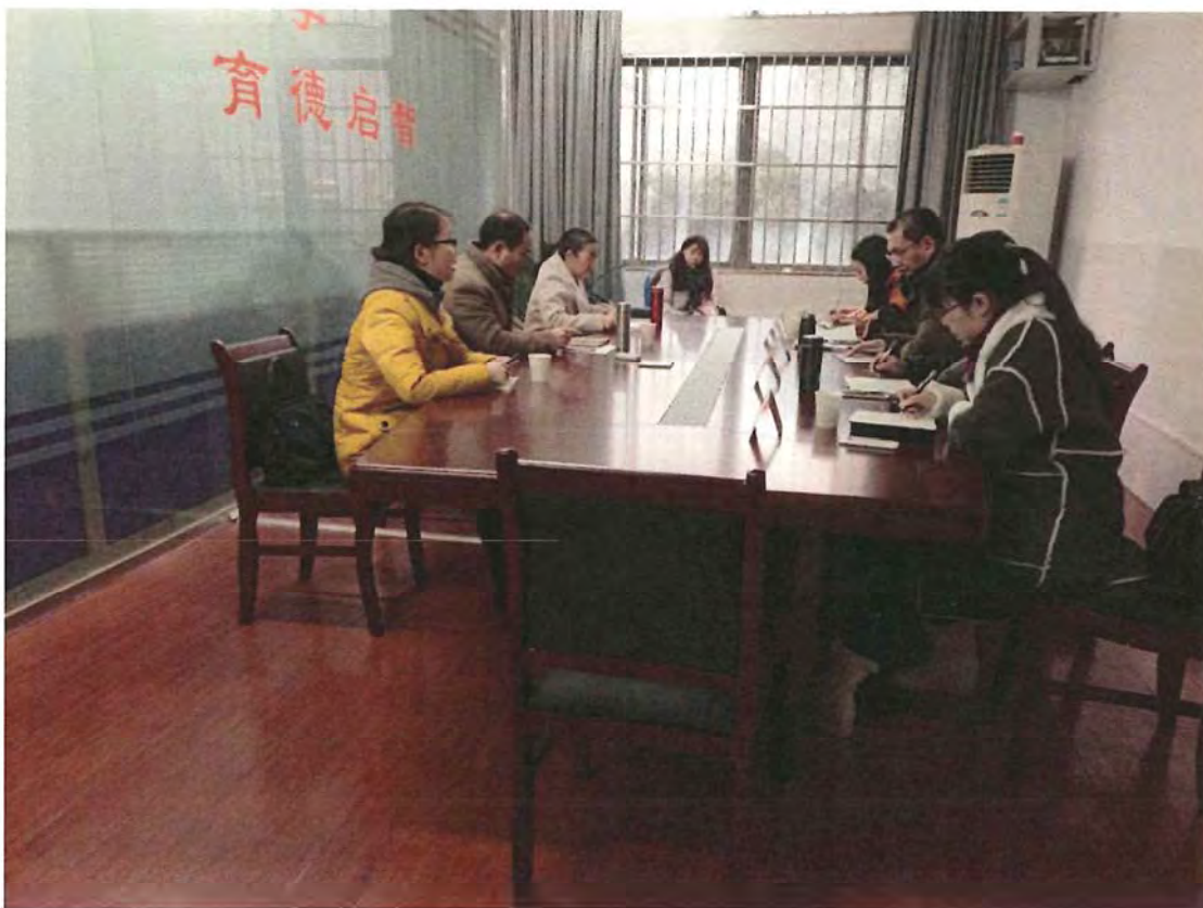
汉中职业技术学院考察团来我校交流（2017.12）