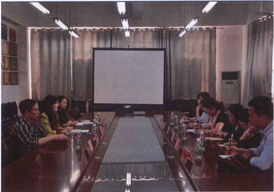
池州学院考察团来我校交流（2015.10）