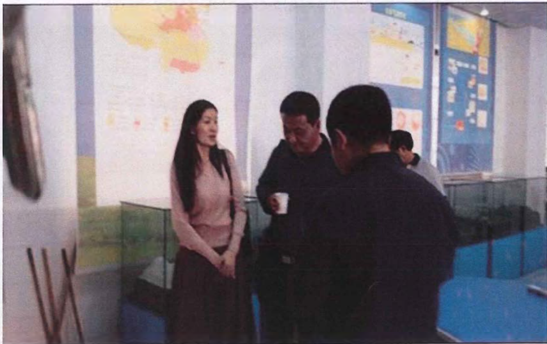
云南楚雄学院考察团来我校交流（2014.10）