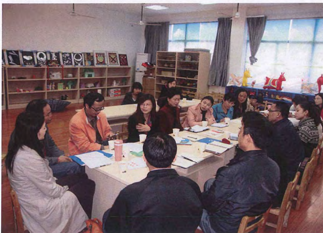
广东外语艺术职院来我校交流 (2014. 03)