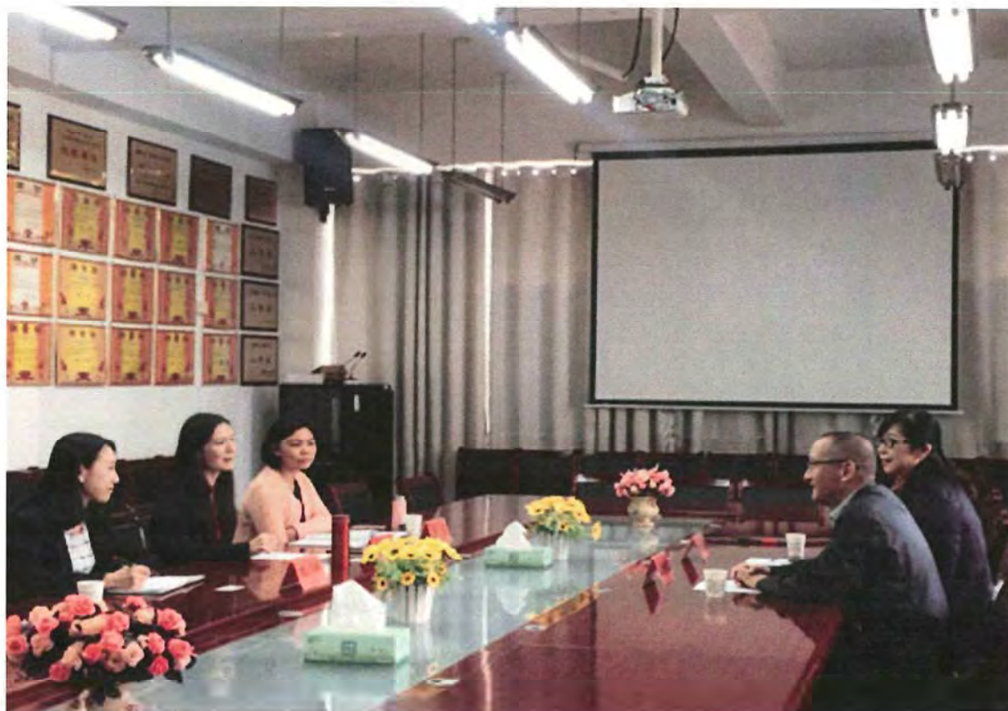
中山职业技术学院考察团来我校交流（2017.10）