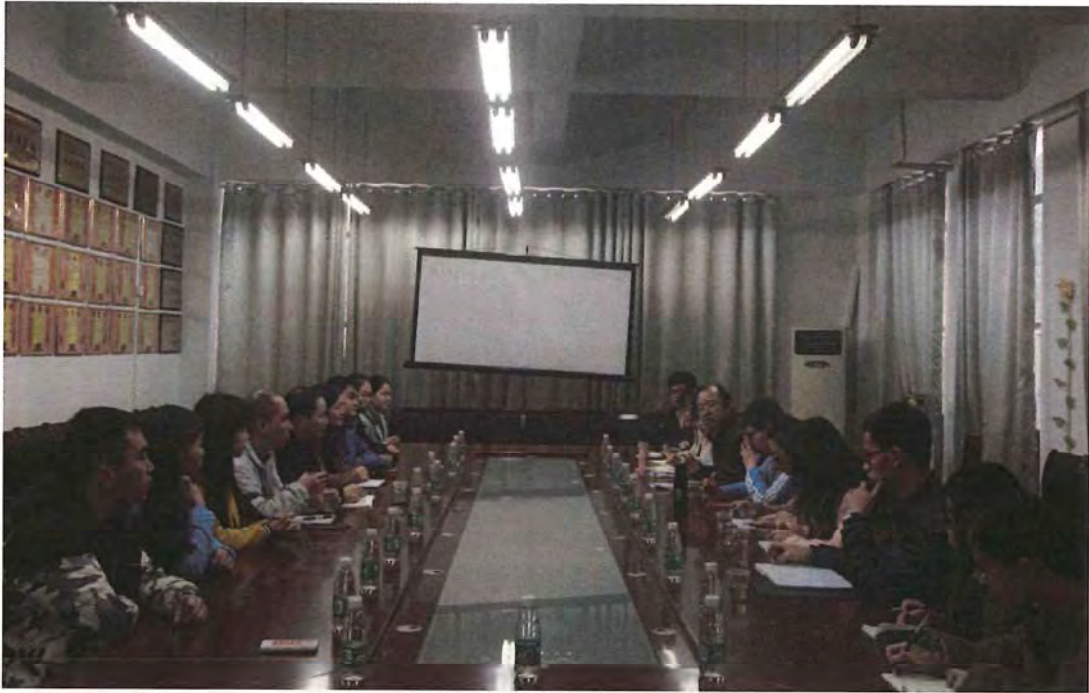
宁夏大学考察团来我院交流（2015.11）