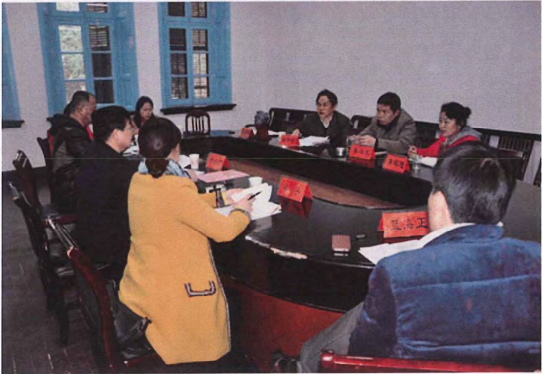
广西师范学院初等教育学院考察团来我校交流（2014.03）