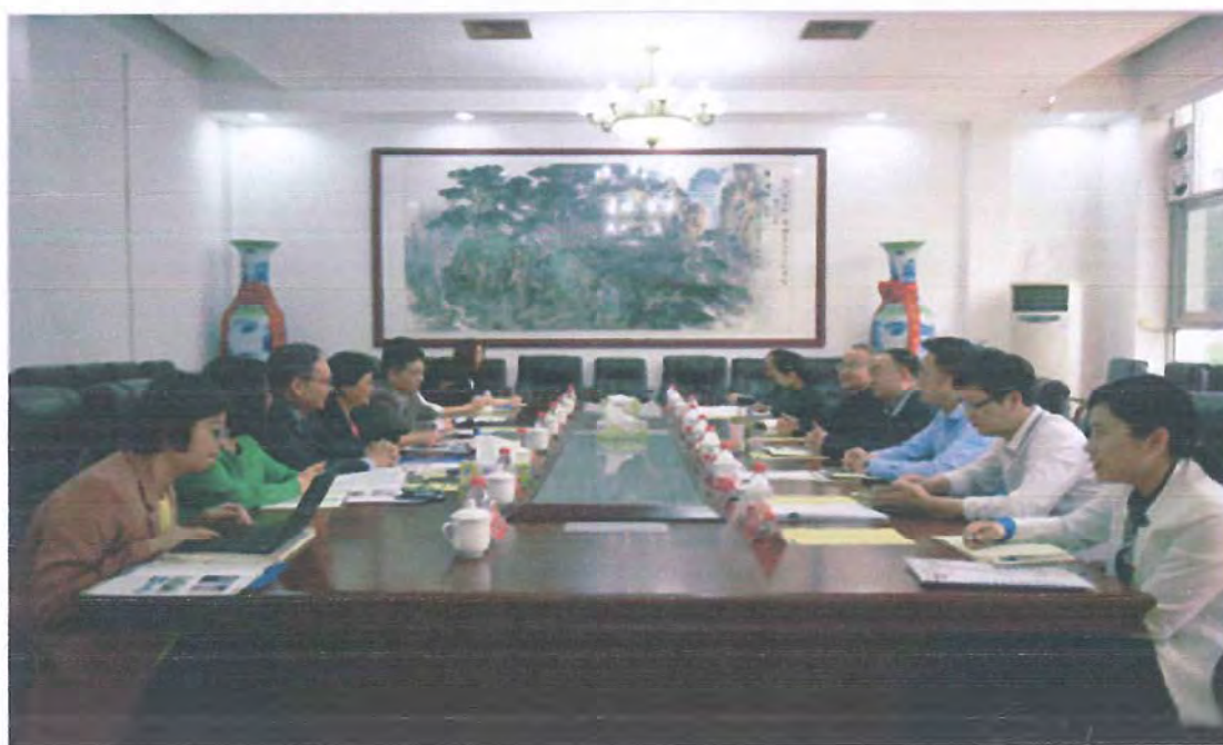
广东第二师范学院来我校考察交流（2018.04）