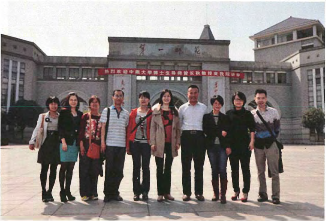
甘肃天水师范学院考察团来我校交流（2012.10）