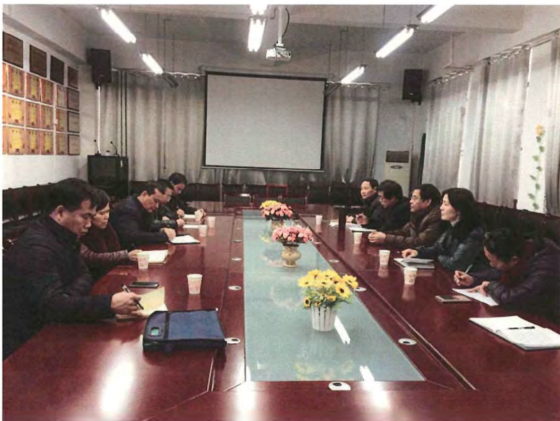
湖南城市学院考察团来我校交流（2017.12）