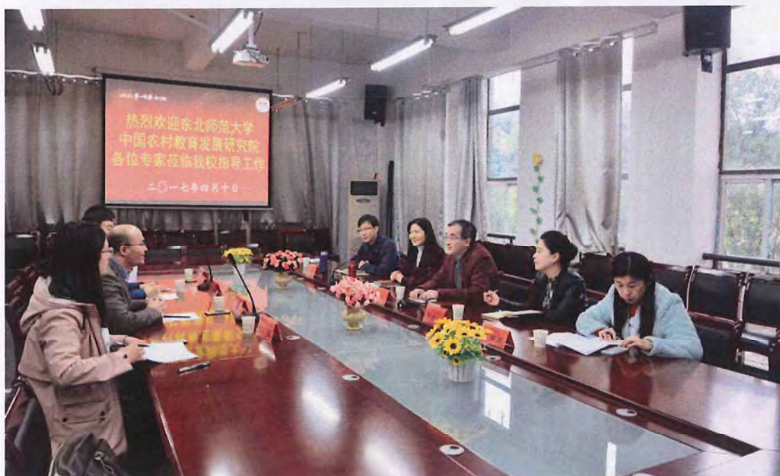
东北师范大学考察团来我校交流（2017.04）