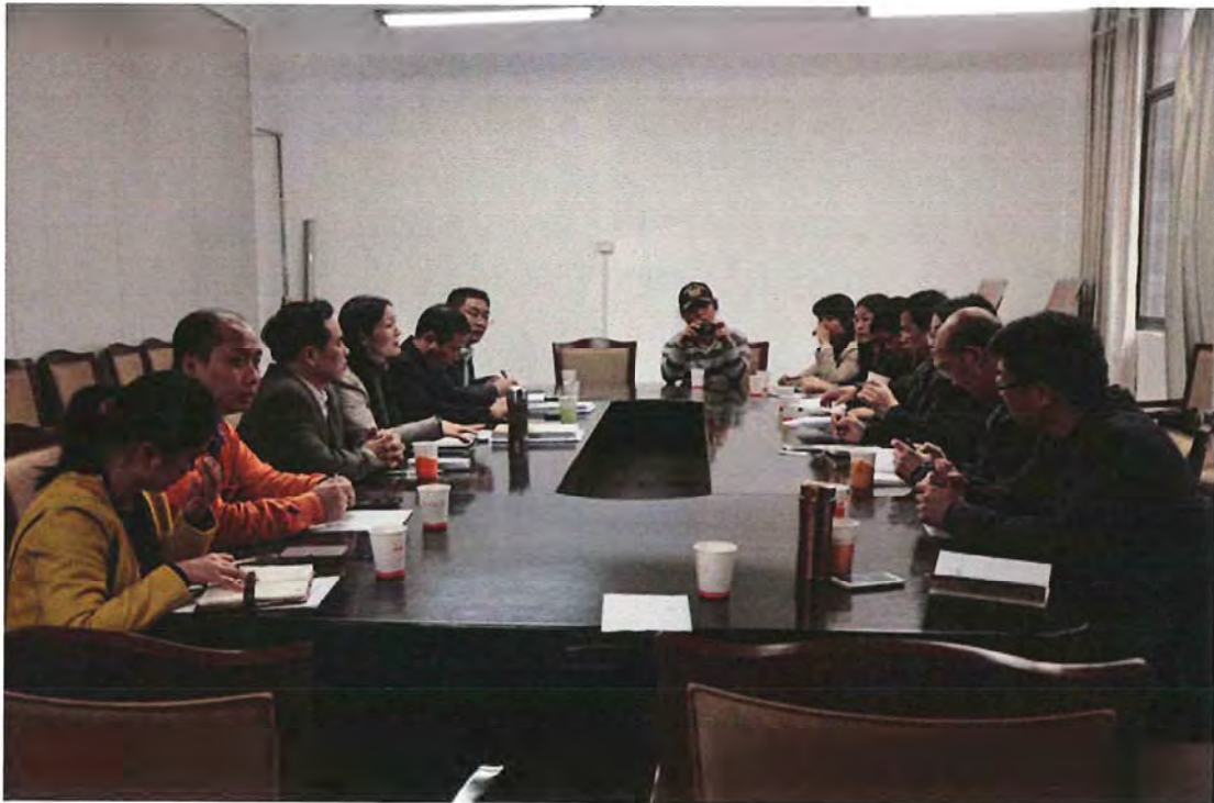
成都大学代表团来我校考察交流（2014. 04）