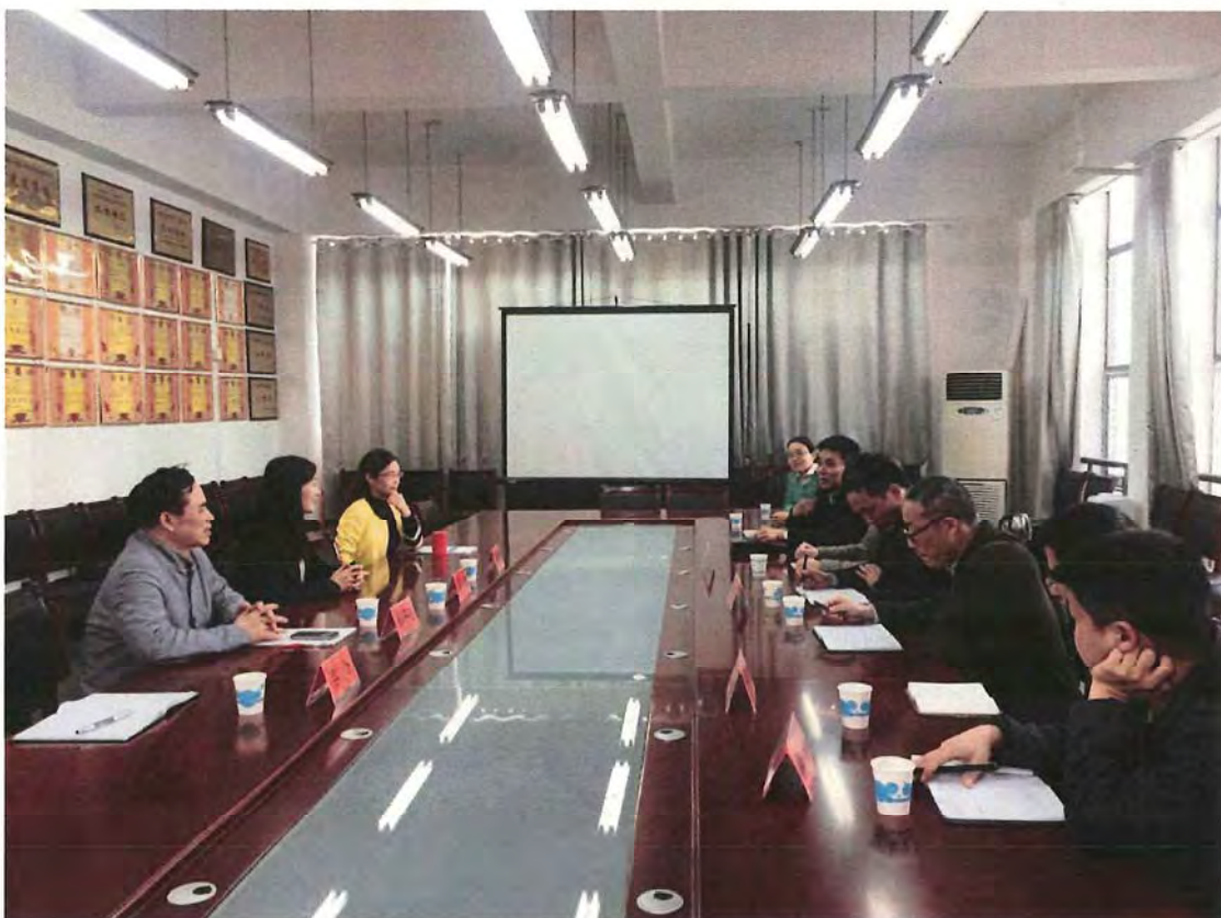
怀化学院考察团来我校交流（2016.04）