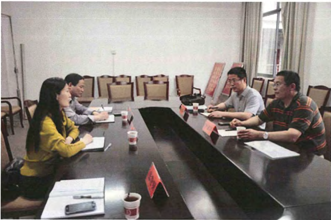
聊城大学考察团来我校交流（2014.05）