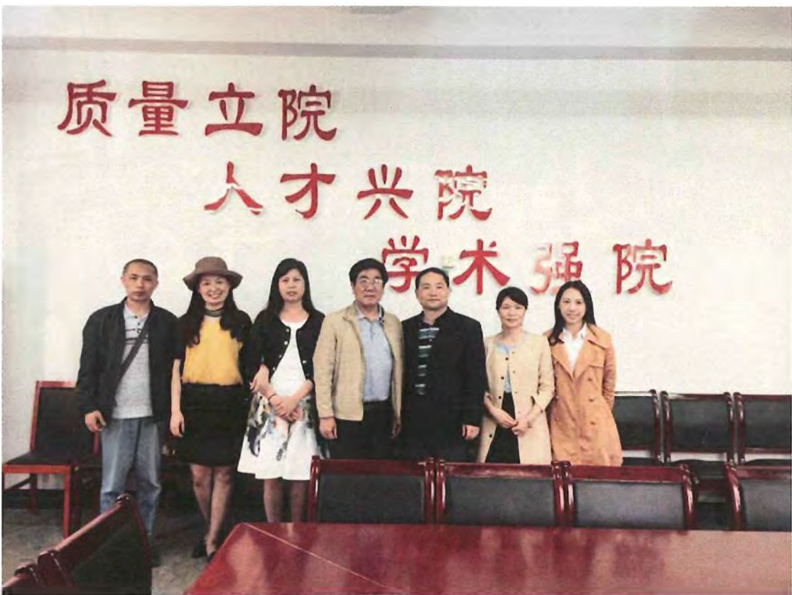
焦作师范高等专科学校考察团来我校交流（2016.05）