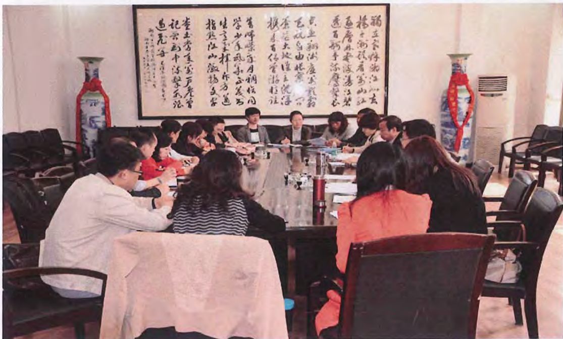
新疆教育学院代表团来我校考察交流（2013.04）