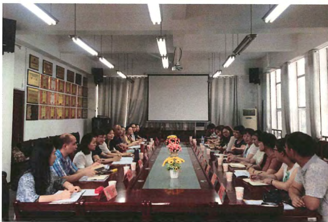
张家口学院考察团来我校交流 (2017. 06)