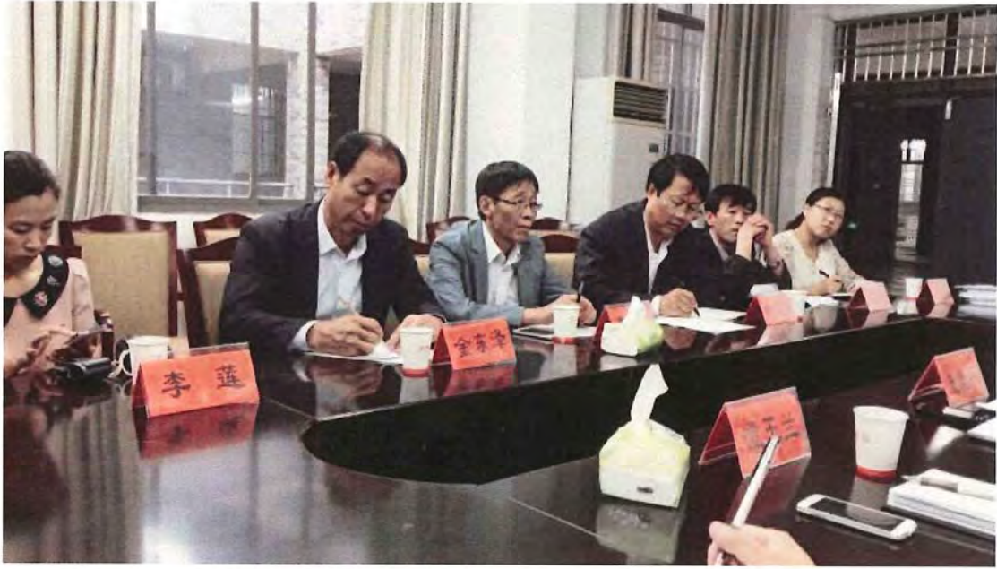
延边大学师范学院代表团来我校考察交流（2014. 10）