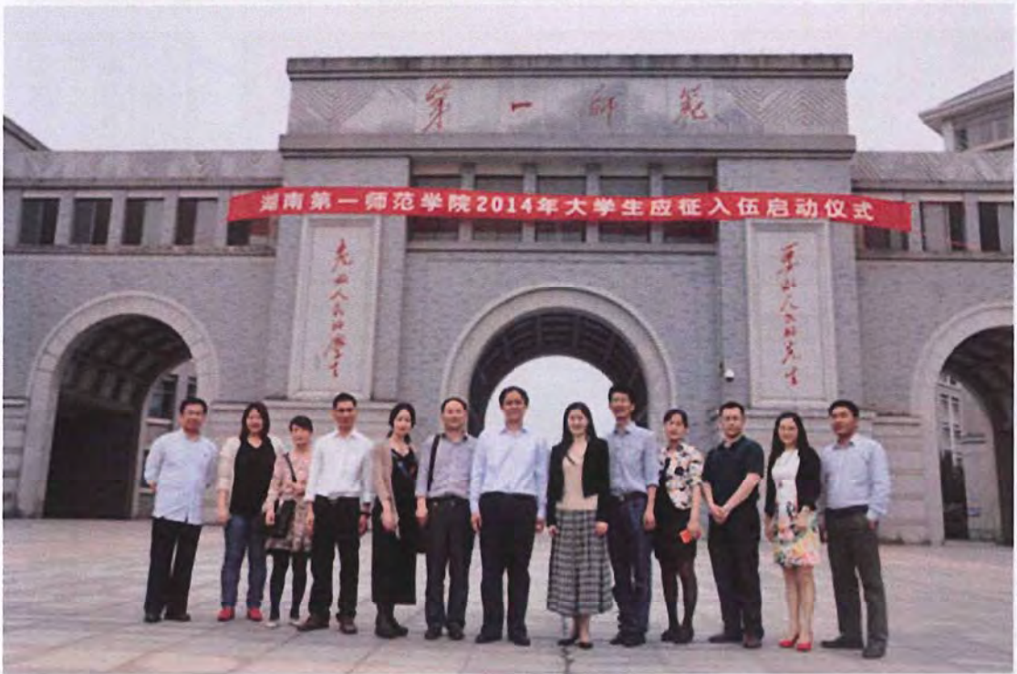
宁波大学教师教育学院考察团来我校交流（2014.05）