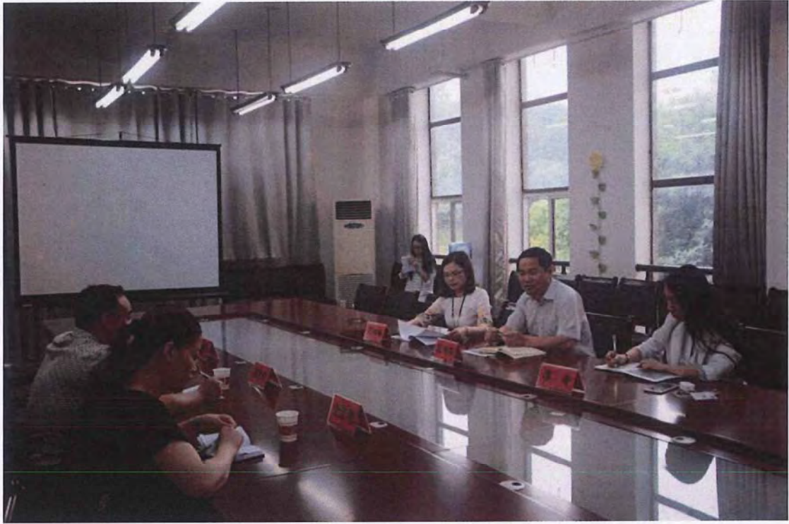
衡阳师范学院考察团来我校交流（2015.04）