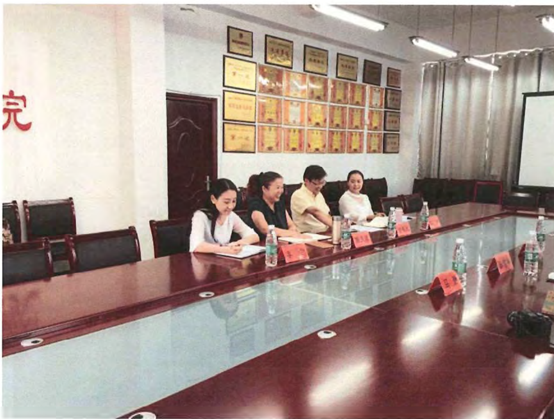
宁夏师范学院考察团来我校交流（2016.9）