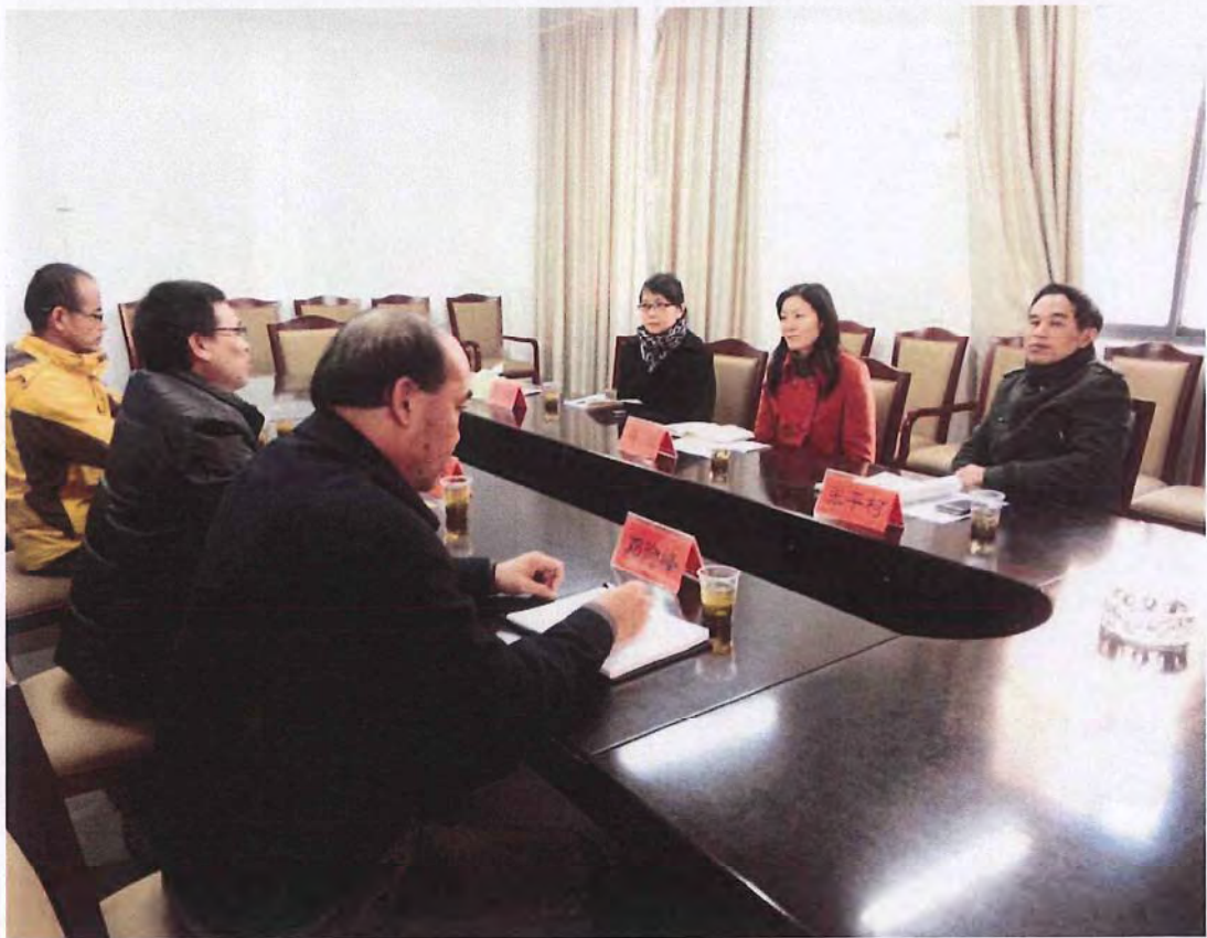
广西贺州学院代表团来我校考察交流（2014.12）