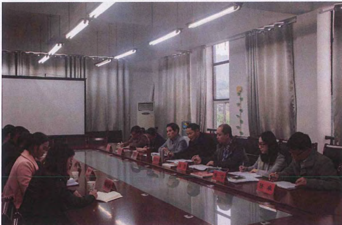
铜仁幼儿师专考察团来我校交流 (2015. 11)