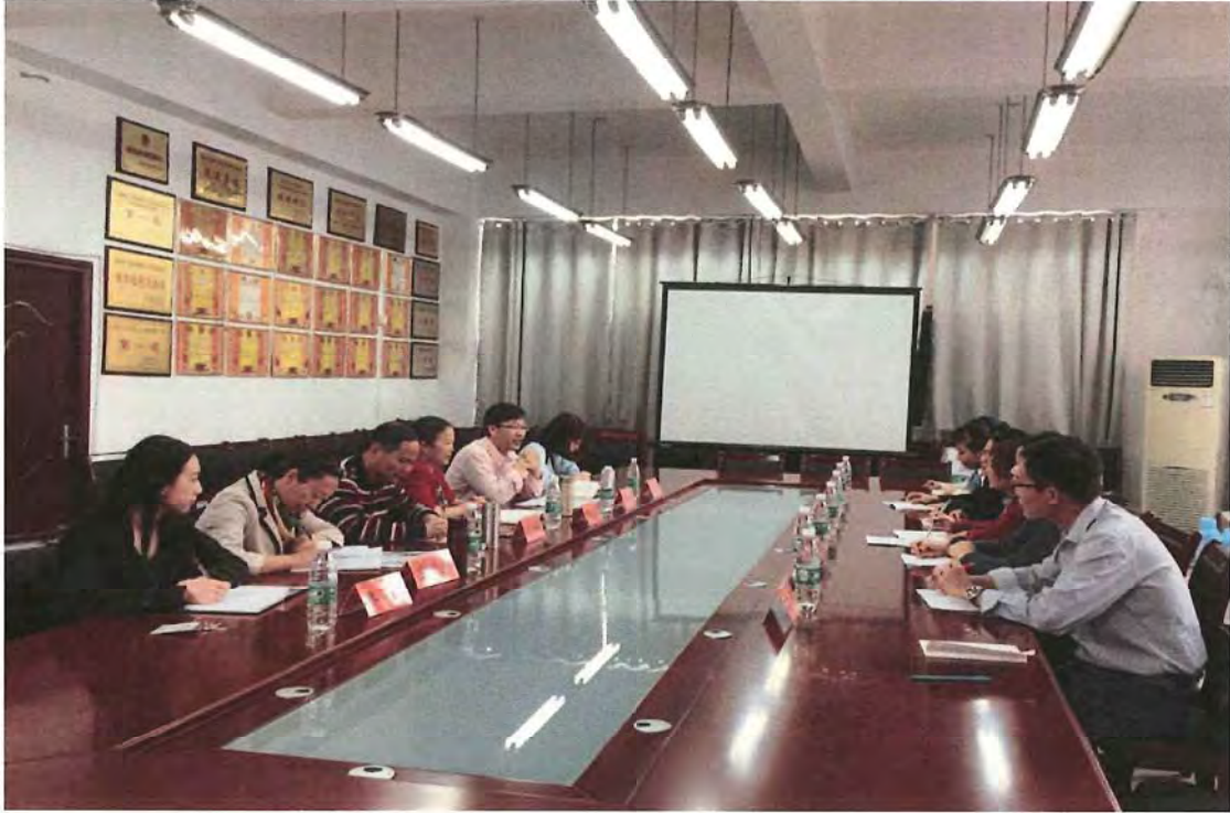
广西幼儿师范高等专科学校考察团来我校交流（2016.10）