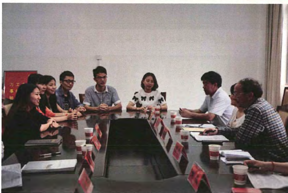
重庆师范大学考查团来我校考察交流（2014.05）