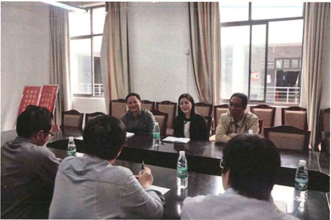
湖南科技学院考察团来我校交流（2014.08）