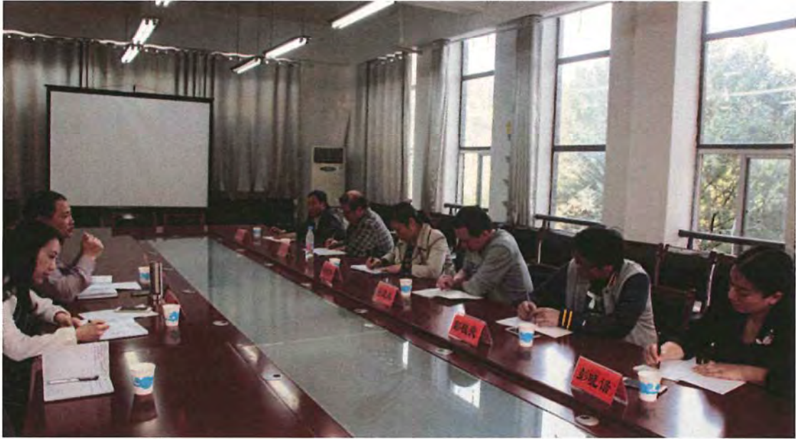
周口师范学院来我校考察 (2016. 04)