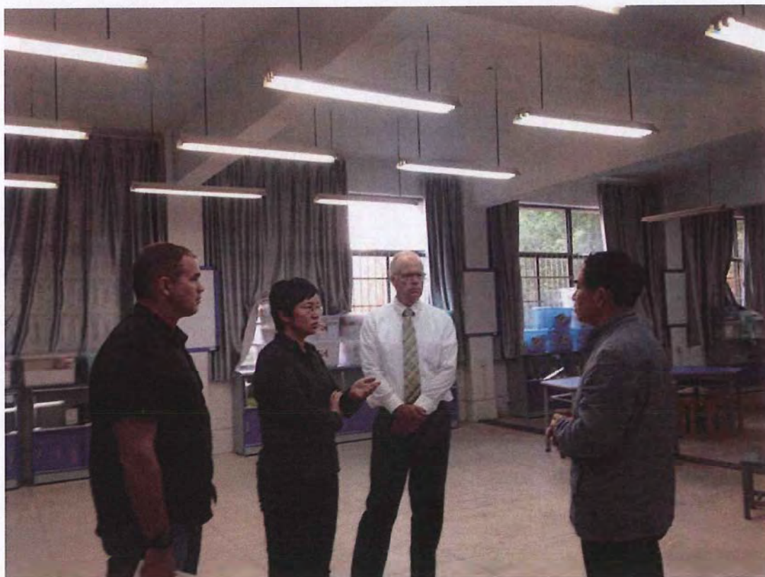
美国南犹他大学科学与工程学院代表团来我校考察交流（2015.05）