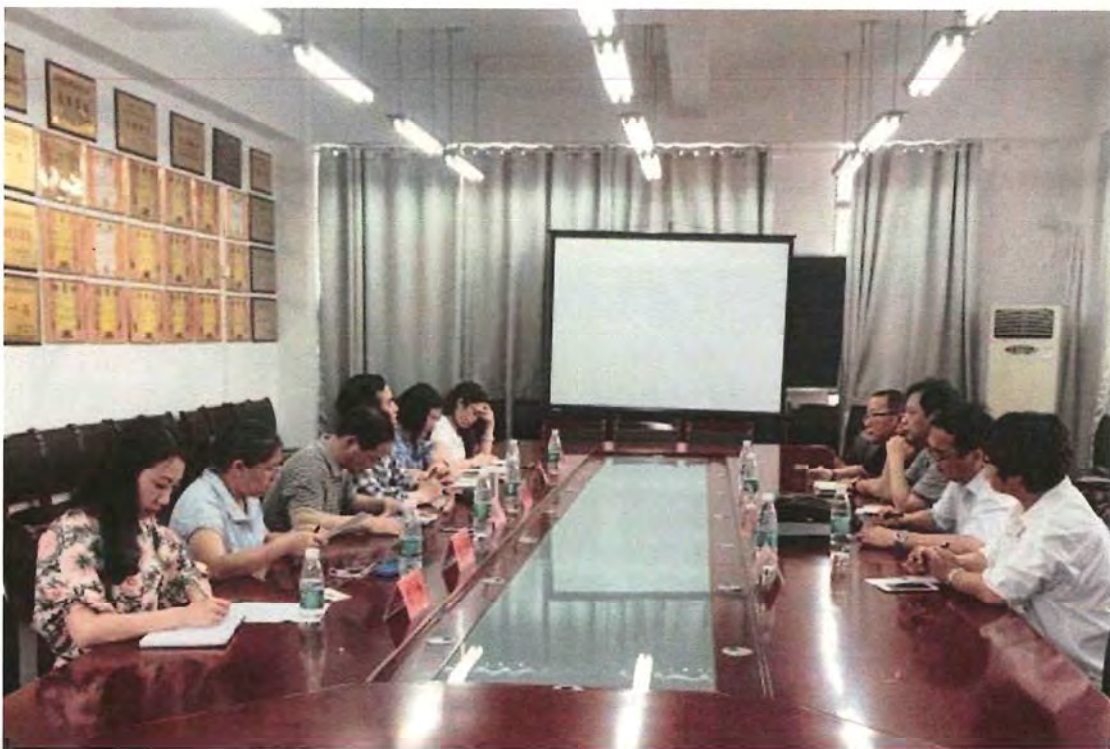
淮南师范学院考察团来我校交流（2016.06）