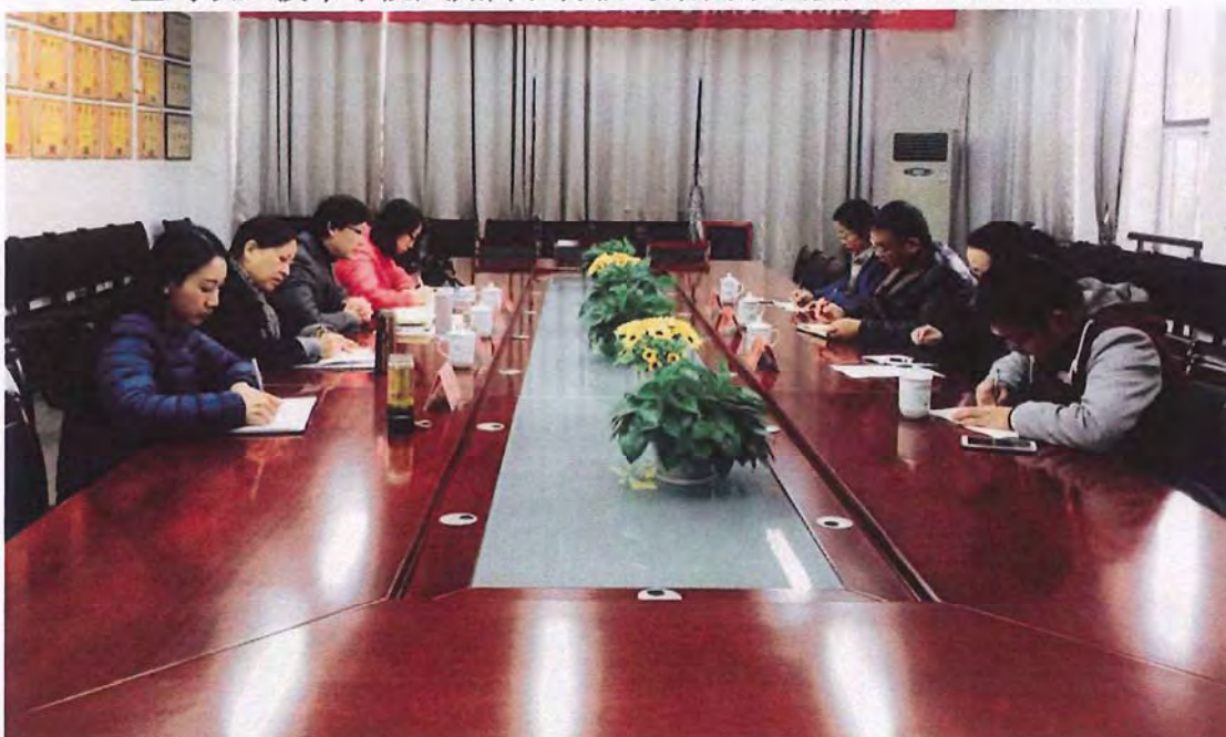
南昌师范高等专科学校考察团来我校交流（2016.12）