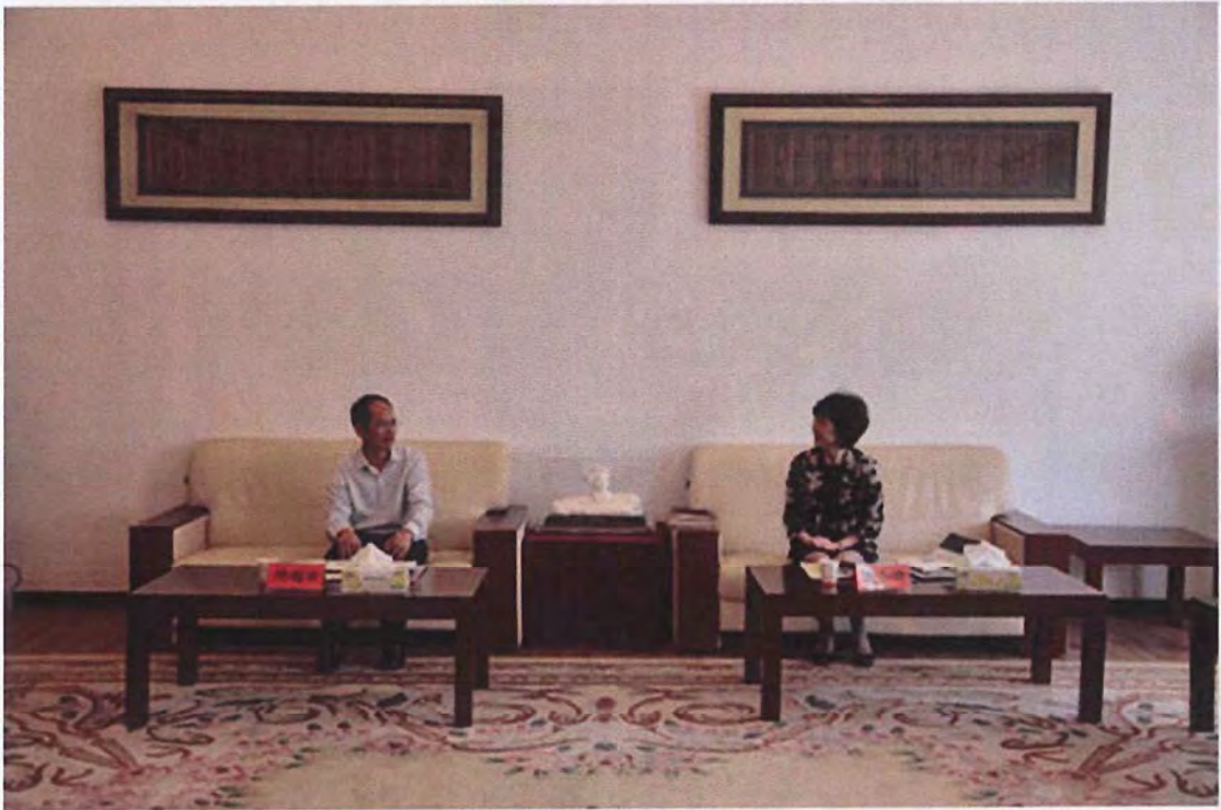
玉林师范学院考察团来我校交流（2014.05）