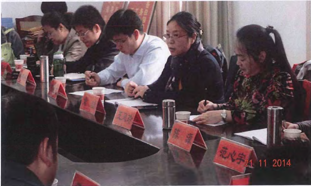
首都师范大学初等教育学院代表团来我校考察交流（2014.11）