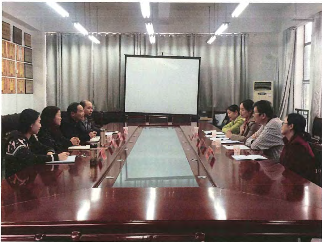
广州大学考察团来我校交流（2016.10）