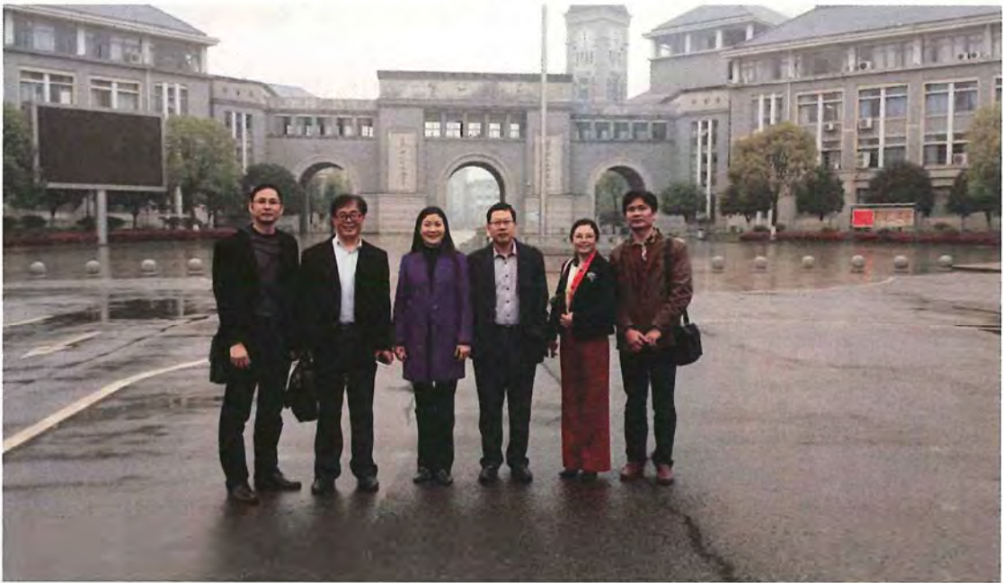
岭南师范学院考察团来我校交流 (2016. 03)