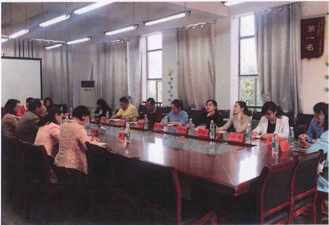
长沙师范学院考察团来我校交流（2015.11）