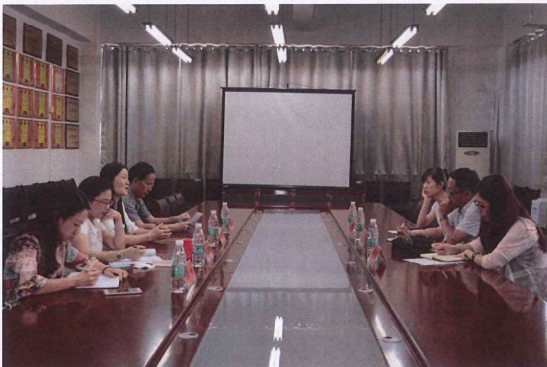
长冶学院考察团来我校交流 (2016. 06)