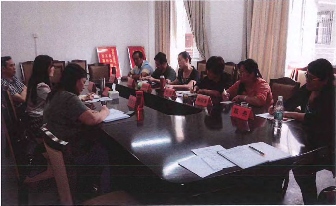
湖南民族职业学院代表团来我院考察交流（2014.09）