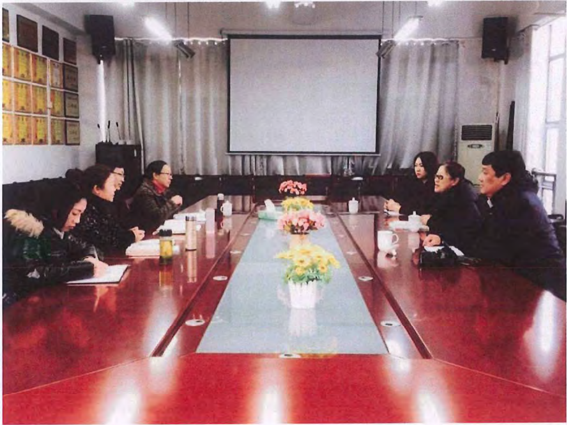
呼和浩特民族学院考察团来我校交流（2016.12）