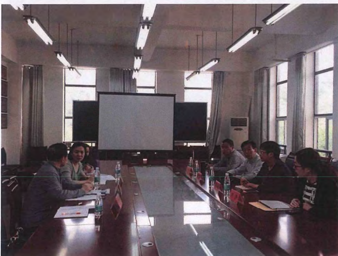
乐山学院考察团来我校交流 (2016. 10)